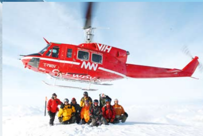
Zur Flotte von Mikes Resort gehören auch einige Bell-212-Helikopter, die jeweils zehn Gäste und zwei erfahrene Guides transportieren.

Und um mit dem Preis hinuntergehen zu können, müsstest du mit dem Service hinuntergehen. Oder auf billigere Maschinen umsteigen, aber das kommt für mich nicht infrage. Billiger fliegen bedeutet höheres Risiko. Und das bin ich nicht einzugehen bereit, schließlich geht es um die Sicherheit meiner Gäste.“