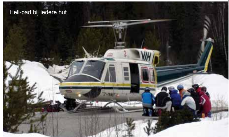
Heli-pad bij iedere hut