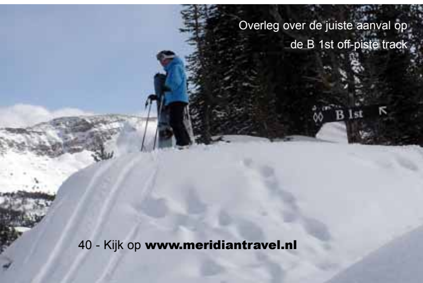
Overleg over de juiste aanval op de B 1st off-piste track