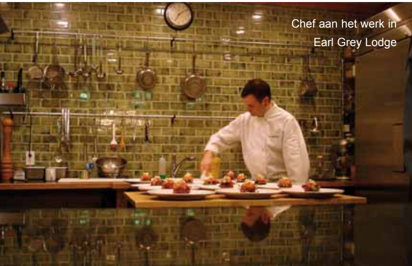
Chef aan het werk in Earl Grey Lodge