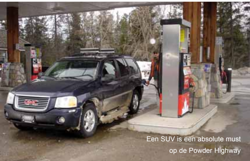
Een SUV is een absolute must op de Powder Highway