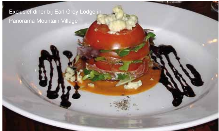
Exclusief diner bij Earl Grey Lodge in Panorama Mountain Village