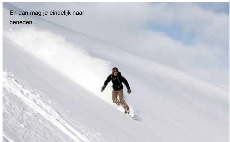
En dan mag je eindelijk naar beneden...