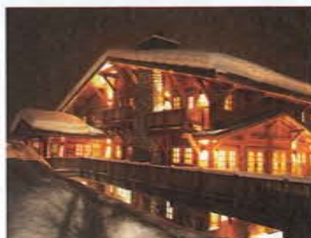
Die Lodge. So stellt man sich das Quartier vor: tief verschneite kanadische Blockhäuser.

Damit die Hubschrauber nicht überladen werden und die Skifahrer entsprechend gleichmäßig auf die Maschinen verteilt werden können. Im Seminarraum warten schon die Guides auf uns und die rund 60 anderen Heliskier. Was folgt, ist eine Vorstellung des gesamten Teams, eine genaue Unterweisung, wie wir uns beim Ein- und Aussteigen, beim An- und Abfliegen des Helikopters und beim Tiefschneefahren im Gelände verhalten sollen. Weil ja Bilder bekanntlich mehr sagen als tausend Worte, gibt es zum Abschluss noch einen Film, der alles veranschaulicht.